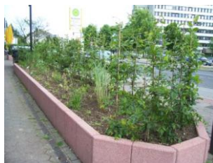
Beete am Neuenhausplatz