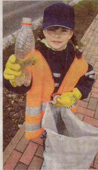
Platz ist in der kleinsten Tüte: Beim Dreck-weg-Tag dürfen alle mitsammeln.

Bei dem Treffen am 25. Mai wird ein Mitglied der Schulpflegschaft über die Situation der Grundschule am Millrather Weg berichten. „Ein Höhepunkt der geselligen Art soll die Besichti-